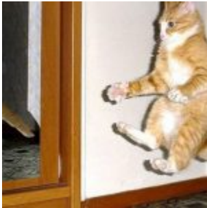
Immagine di copertina ph. Luca Chiaudano

Se Macao fosse immesso nel mercato immobiliare questa chance non ci sarebbe. È evidente che sui soldi si è sempre perdenti. Non ci si può battere con la Sogemi SpA perché le armi non sono pari. Ma Macao è ancora un luogo comune, per il quale ci si può battere anche con astuzia giuridica.