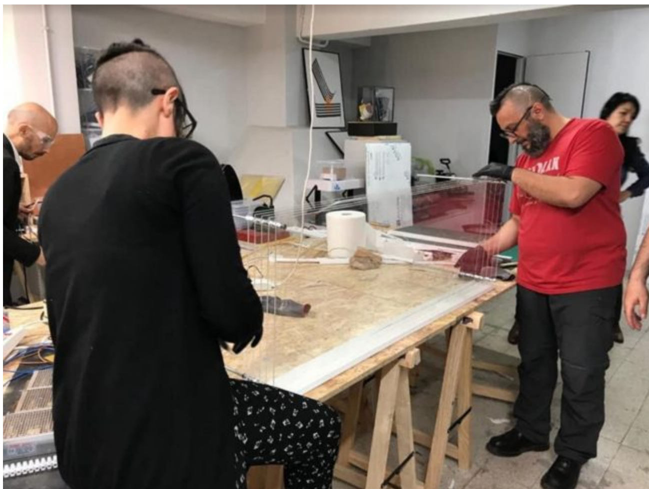
Costruendo Obiettivo a Spazio Chirale