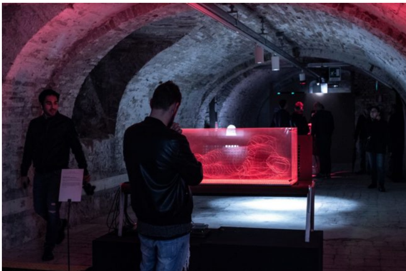
Obiettivo, art+b=love(?) Festival 2019 , Ancona

Per 5 giorni lavoreremo, ci comporteremo e vivremo come il team della futura startup datapoietica: un'esperienza performativa di ricerca e produzione durante la quale immaginare collaborativamente la forma, l'organizzazione, la comunicazione e i prototipi di una prima linea di oggetti di design e servizi ispirati alla nostra instancabile lampada che vuole renderci sensibili alla povertà.